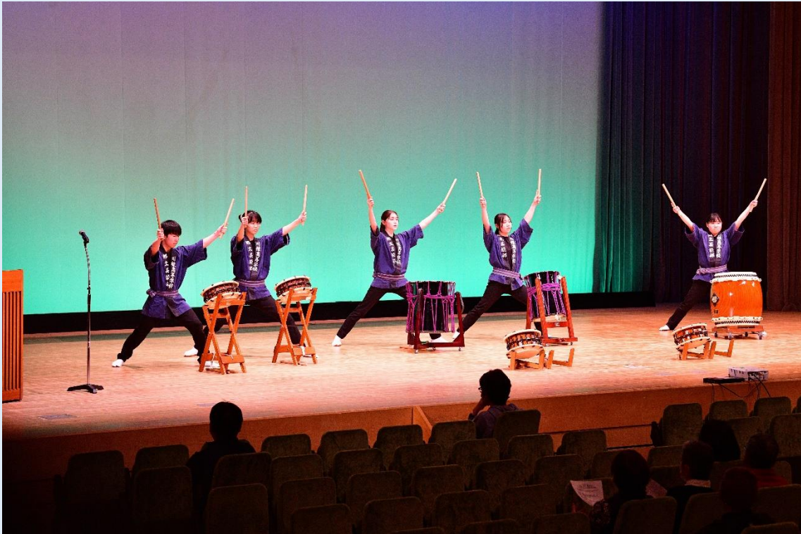
講演前の時間は川根高校郷土芸能部が赤石太鼓を披露